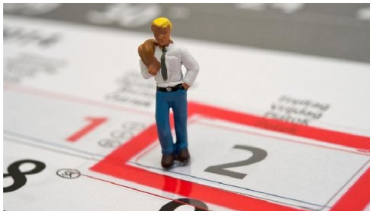
Vor dem Urlaub sollten Arbeitnehmer auf einige Punkte achten - sonst droht Chaos.

„Grundsätzlich sind solche Nachrichten aber gut.“ Entscheidend sei, sich zu überlegen, was genau die Kollegen wissen müssen. Denn E-Mails zum Abschied in den Urlaub dienen schließlich in erster Linie dazu, Kollegen darüber zu informieren, ab wann Beschäftigte weg und wann sie wieder da sind. „Das ist ein Arbeitsinstrument, das anderen hilft, zu planen und Entscheidungen zu treffen“, erklärt Geißler. Wenn alle Kollegen wissen, wann der Urlauber wieder zurück ist, lassen sich Termine leichter planen, für die er gebraucht wird.