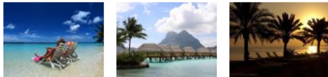
Bildergalerie (6 Bilder)