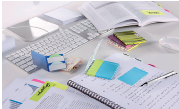
Praktisch und trendy zugleich: EtikettenBlöcke und HaftRegister im Designbooklet